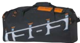
Torba sportowa Stihl TIMBERSPORTS®