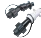
System napełniania paliwa i oleju