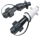
System napełniania paliwa i oleju